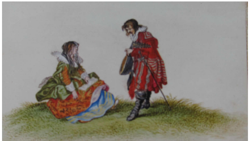
Ontspanning van de Haagse jeunesse dorée Adriaen Van de Venne 1626