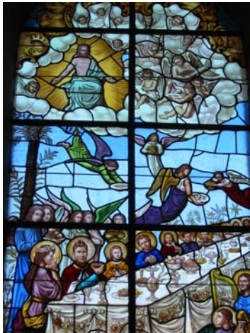
Luitspelende engel in het kerkglasraam