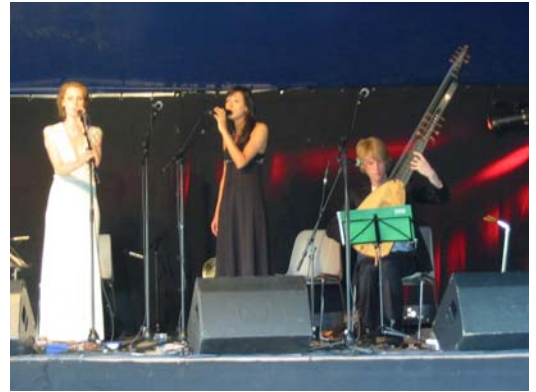
Golden Glows & P. Theuns, Graindelavoix