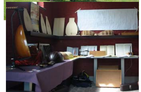
Dirk De Hertogh, altijd paraat met zijn lezing over luitbouw