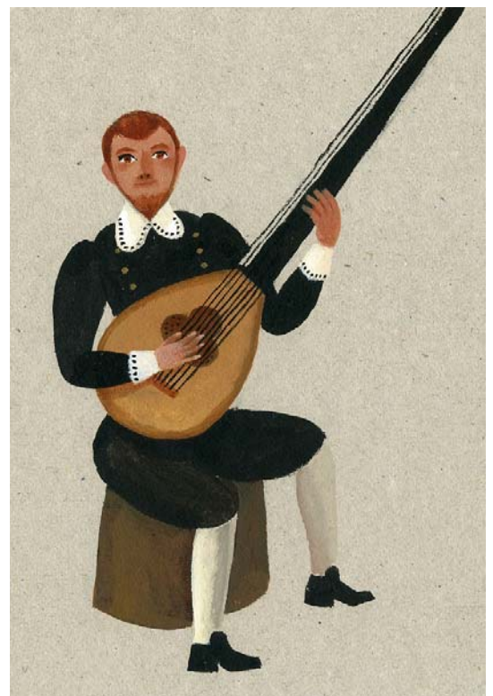
Illustraties © Tom Schamp

Bovenstaande tekst zal ook in het jaarboek 2009 verschijnen.