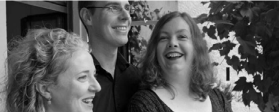
Alden Biesen Dag van de Oude Muziek: Le Jardin Secret

Het ensemble "les luths réunis" zal op 5 juni een Renaissance dansatelier animeren in het Musée du Coudenberg, 1000 Brussel. Meer info op : http://www.coudenberg.com/fr/preparez-votre-visite/presentation