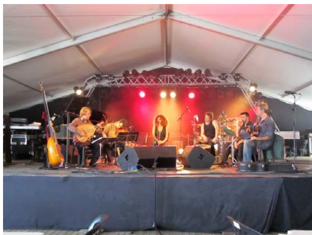
Pastor de Amor op het festival "Ten Vrede" te Diksmuide op 21 mei 2011