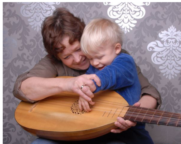
Jong geleerd is oud gedaan

http://histoforum.digischool.nl/luit/index.htm