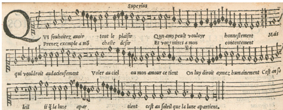
Afb.2: voorbeeld uit het Vingtneufiesme [Livre] contenant XXIX.Chansons (1549)